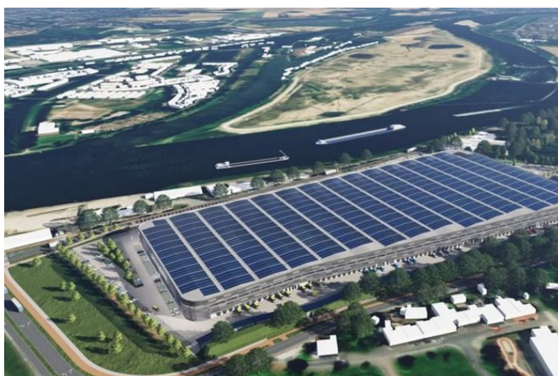
De megaloods waar Leeijen vergunning voor aanvraag.

Voor de wijk Limmel, die dacht na twintig jaar eindelijk de woonwijk Limmel aan de Maas voor elkaar te hebben, dreigde plots een vijftien meter hoge loodswand. De wijk reageerde woedend en hield diverse (ludieke) acties. De gemeenteraad besloot unaniem het Leeijen zo moeilijk mogelijk te maken.