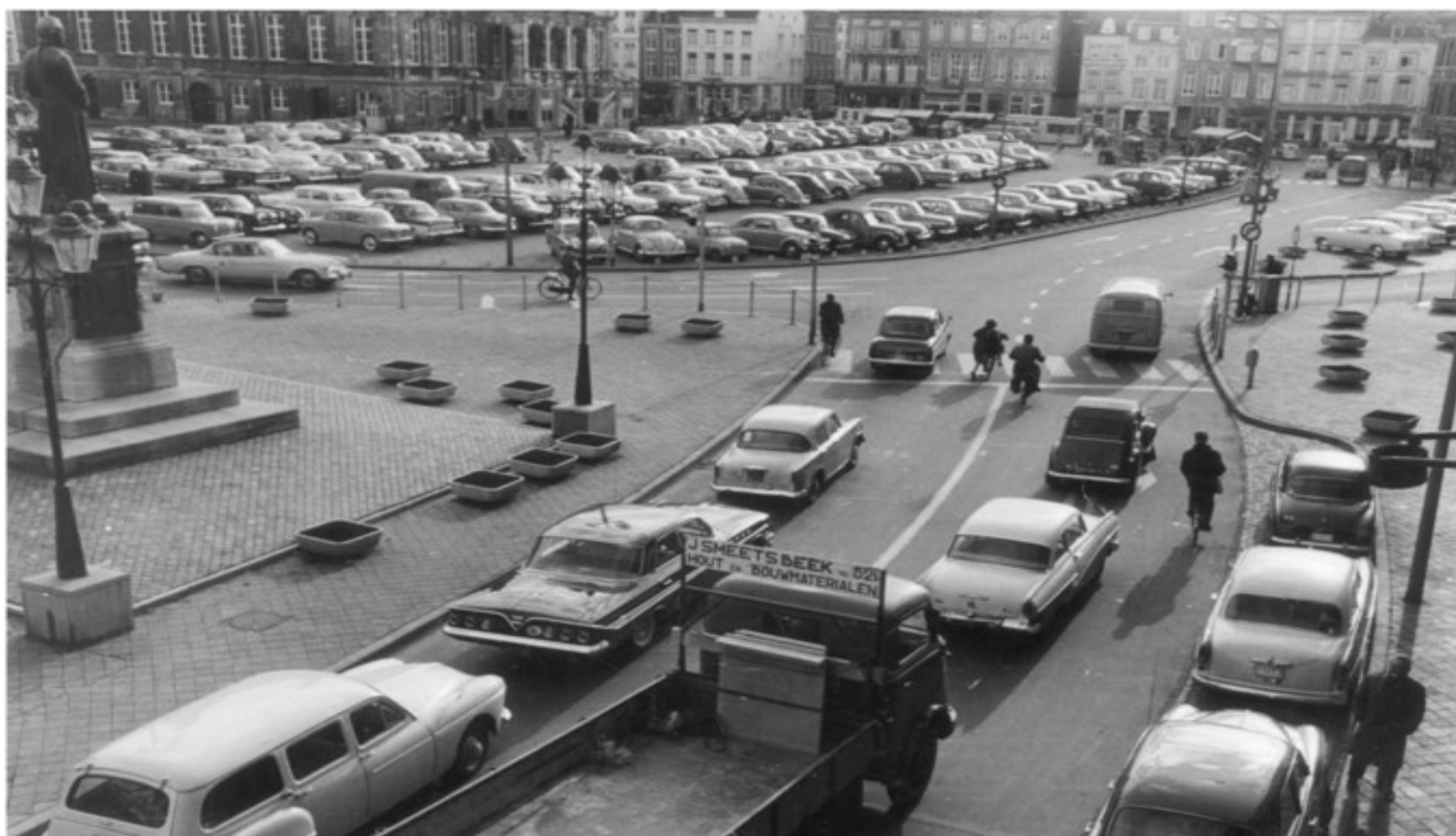
De Markt in de jaren zestig: heel veel blik.

Het autobezit in Maastricht ligt al relatief laag, maar in de toekomst wordt dat alleen maar minder. Aan de andere kant zijn er wel meer dagjesmensen die met de auto komen. De stad wil daar nog slimmer op inspelen.