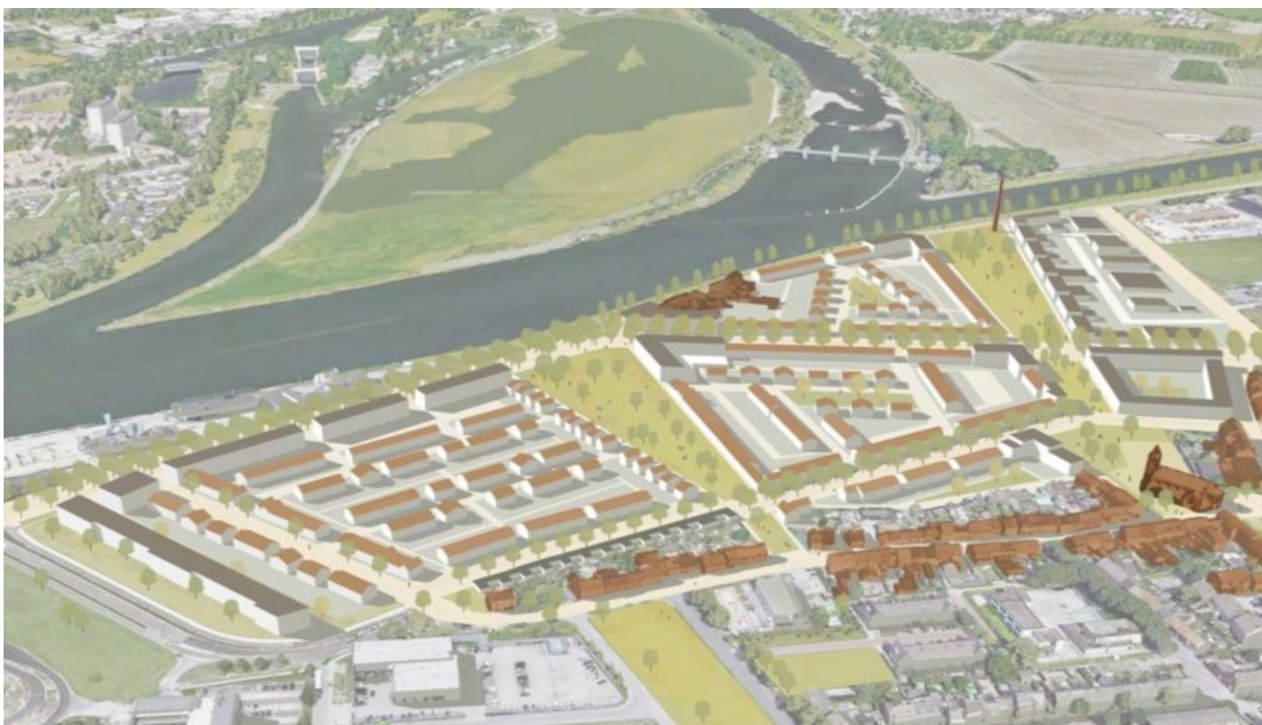
Het woningbouwplan Limmel aan de Maas. Helemaal links onderaan moet de park-and-ride komen. Afbeelding: Ziegler Branderhorst

Op 7 juli leken alle betrokkenen akkoord met 'Limmel aan de Maas', een nieuw gebied met 814 woningen. De wijk Limmel zou eindelijk van zijn isolement verlost worden. Twee weken later kwam het loodsplan van Rien Leeijen als een mokerslag.