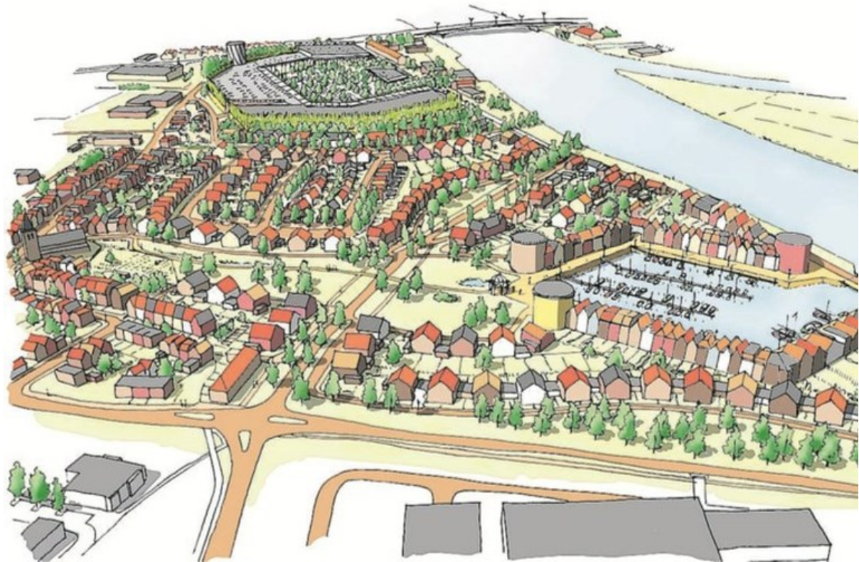
Plan voor Limmel aan de Maas uit 2010.

Dat laatste verdient de voorkeur. Limmel heeft in feite een plan van 'stadsbelang' geproduceerd, met een fraaie ontsluiting van dit stuk Maastricht naar het buitengebied. Het lijkt het onderzoeken meer dan waard, ook omdat in de woningmarkt alle seinen op groen staan. Wil Maastricht op deze cruciale plek echt liever iets doods als parkeren en zonnepanelen? De eerste gemeentelijke reactie op het wijkplan is uiterst formeel, straalt geen flintertje passie uit.