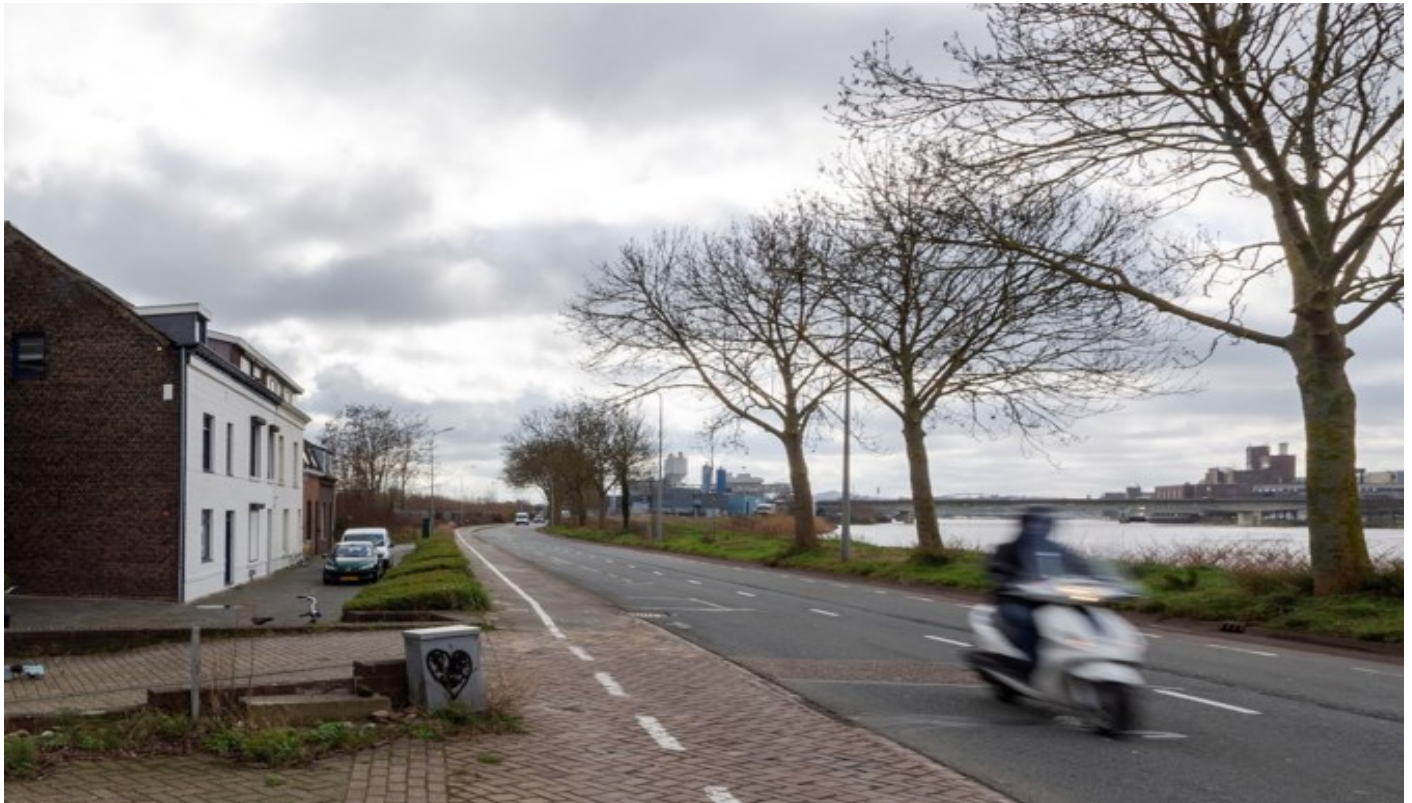
De nederzetting Beck bij Limmel aan de Maas. Afbeelding: Peter Schols

Een feelgoodplan voor een nieuw, leuk stuk Maastricht. Een gouden kans voor de gemeente zou je denken. Maar die reageert vooral terughoudend.