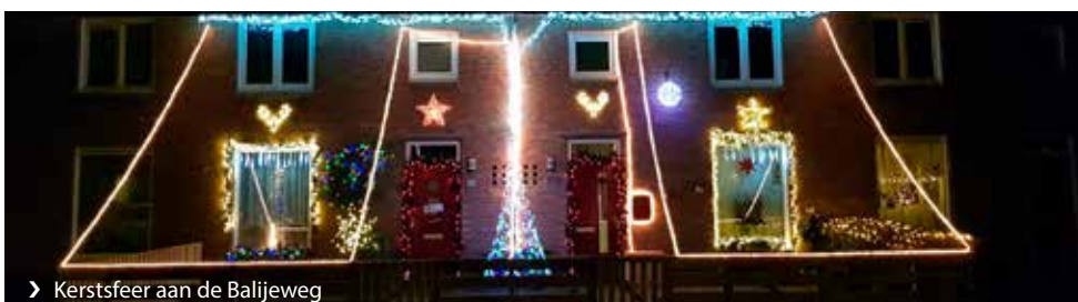
› Kerstsfeer aan de Balijeweg