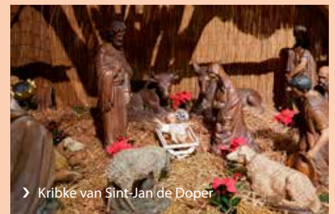
› Kribke van Sint-Jan de Doper

De locatie is bovendien donker en onveilig. Het Buurt netwerk heeft de gemeente erop aangesproken. Er is beloofd dat er in januari verlichting komt in de bushokjes.