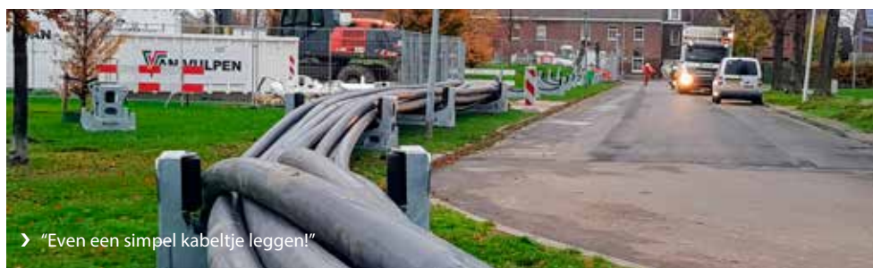
› "Even een simpel kabeltje leggen!"

Wij hopen dat Servatius haar plannen heroverweegt naar aanleiding van het pleidooi van de omwonenden en het Buurtnetwerk. De gemeente roepen wij op om Servatius uit de brand te helpen met de dure kosten van bouwgrond Askalonstraat- Sionsweg.