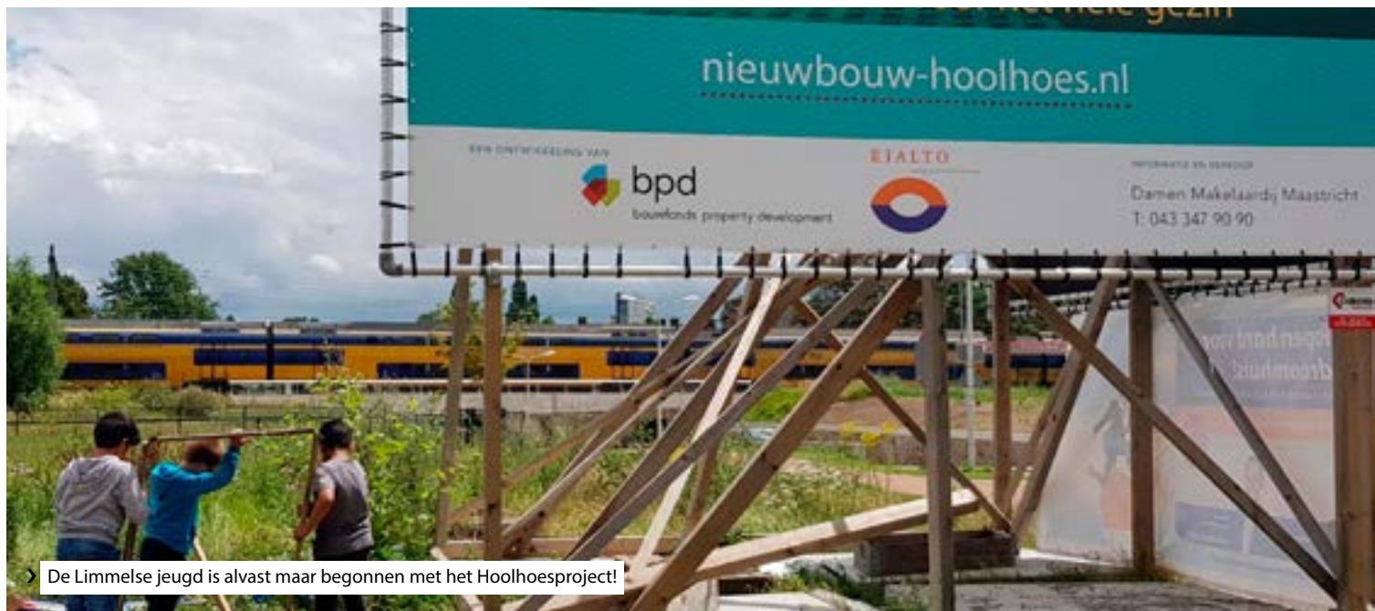
> De Limmelse jeugd is alvast maar begonnen met het Hoolhoesproject!