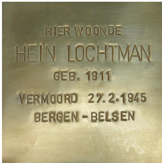
Struikelsteentje geplaatst 21-10-2013