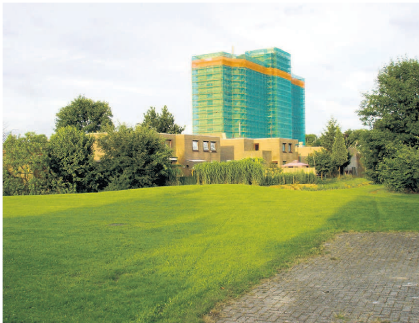
Tbs-kliniek De Rooyse Wissel in Limmel.

Hij zegt echter ook dat de balans zoek raakt. "Ik voorzie in de toekomst escalaties als dit zo door gaat. Cliënten raken gefrustreerd omdat ze door het te trage en te strakke verloftoetsingssysteem en het tekort aan personeel vaak te lang moeten wachten op verlov. Ook zitten ze veel meer op cel dan noodzakelijk is