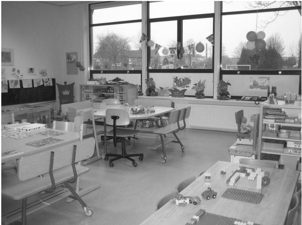
Peuterspeelzaal "de Grummelkes"