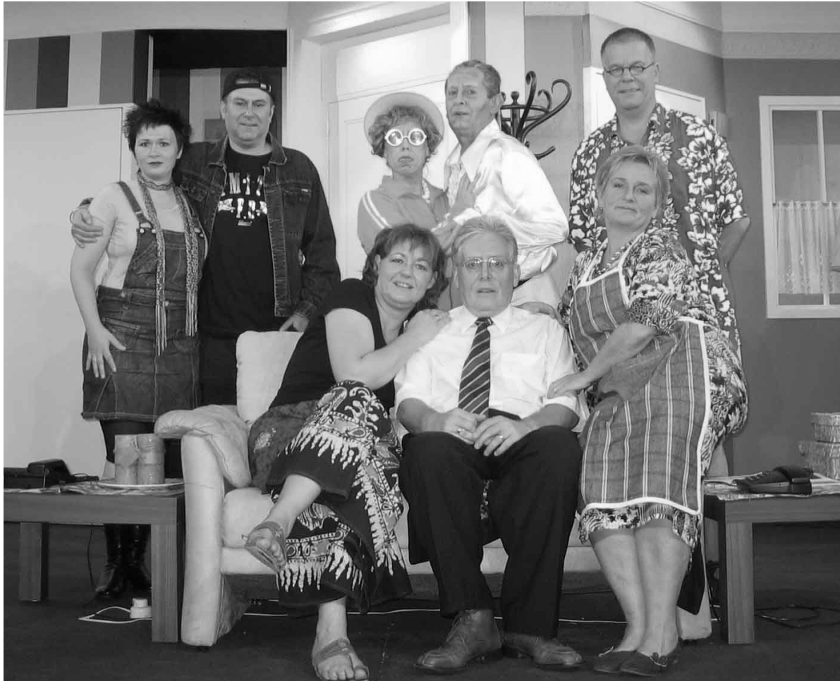
cast van “Miene maan diene maan”