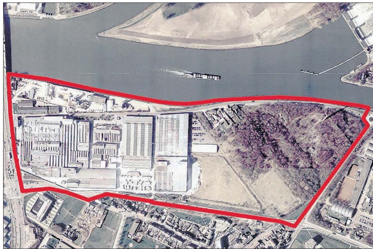
Huidige situatie: links de leegstaande Tregafabrik, het braakliggende stuk rechts is het voormalige Zinkwit-terrein.